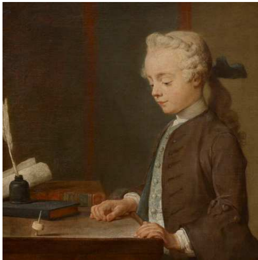
L'enfant au toton / J. S. Chardin, 1738