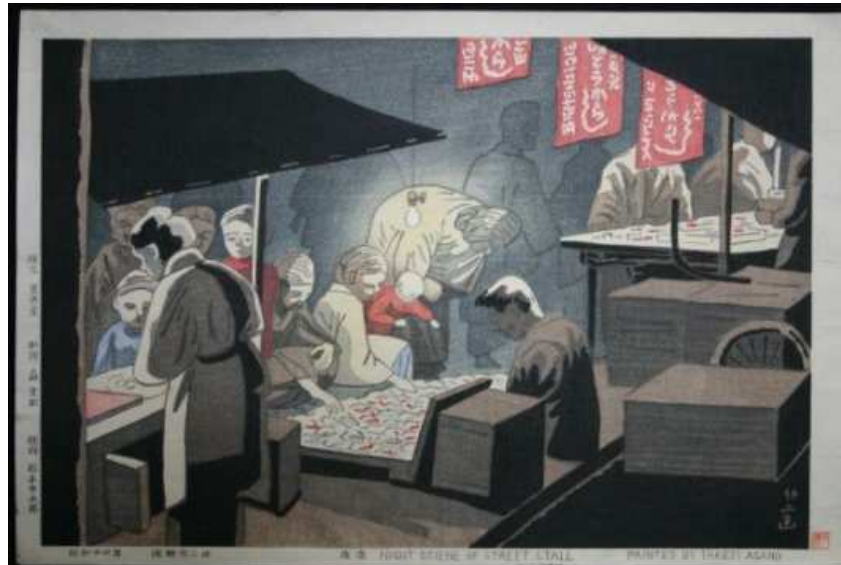
Scènes de nuit sur les étals d'un marché / Takeji Asano